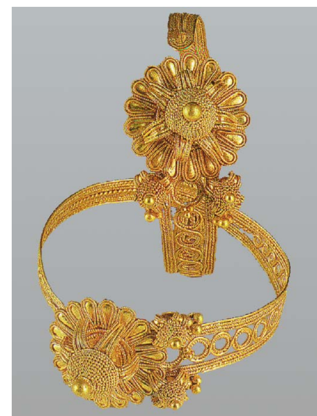
4. Ζεύγος χρυσών ενωτίων από το νεκροταφείο.