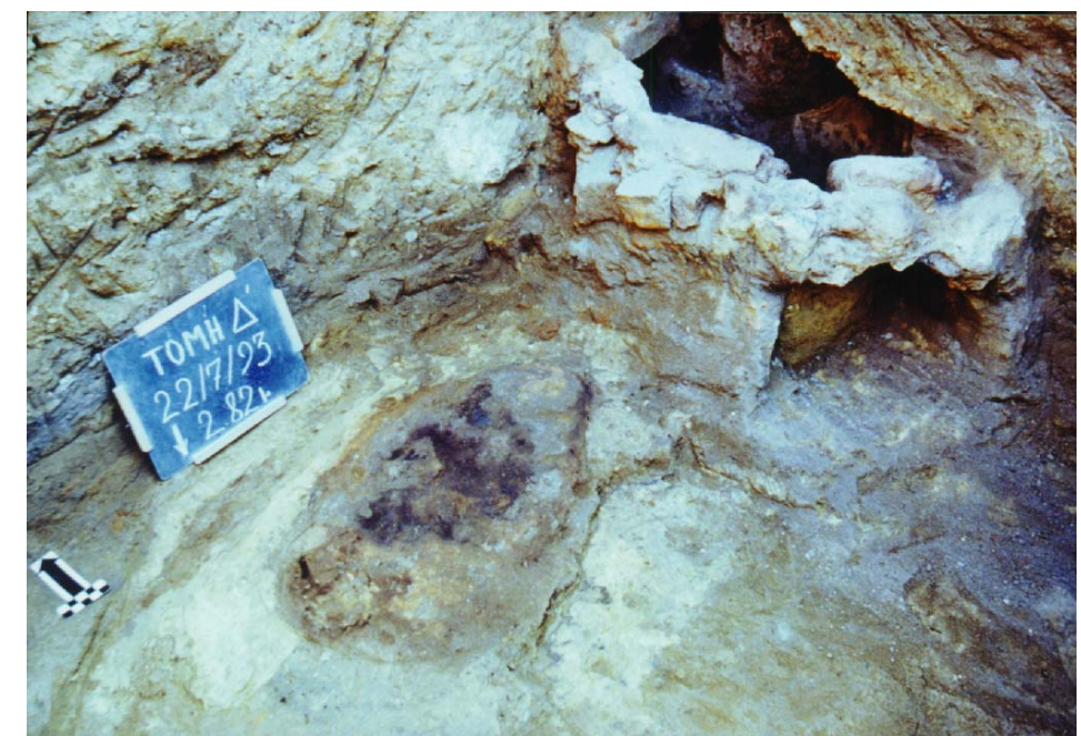
2. Μαγειρικός κλίβανος (φούρνος).