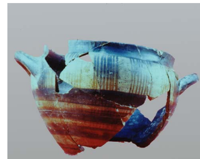
3. Σκυφοειδής κρατήρας γεωμετρικών χρόνων.