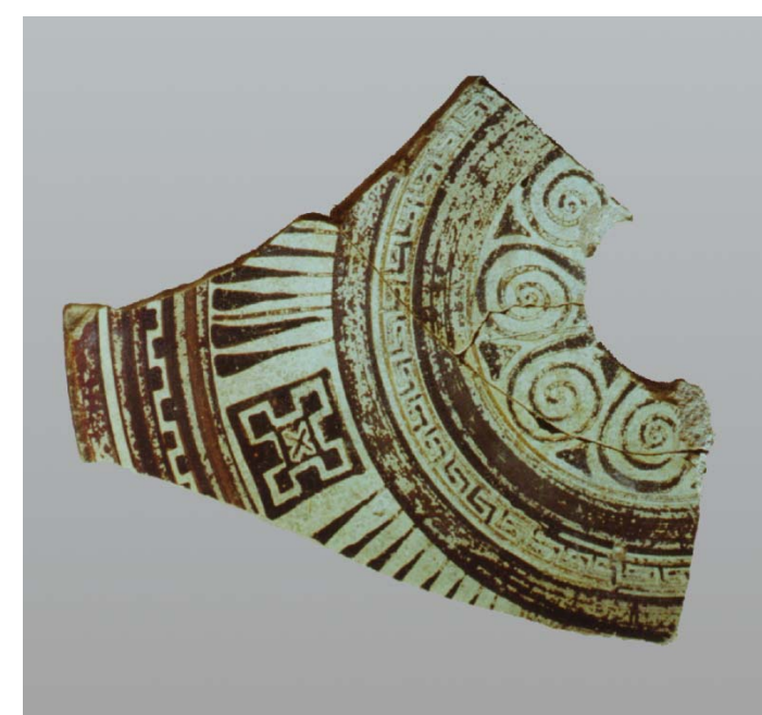
2. Αποσπασματικό πινάκιο από εργαστήριο της Ανατ. Ελλάδας.