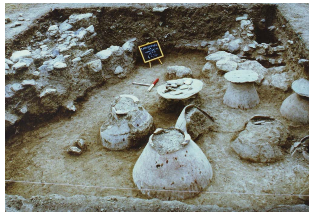
1. Αποθηκευτικός χώρος αρχαϊκού σπιτιού.